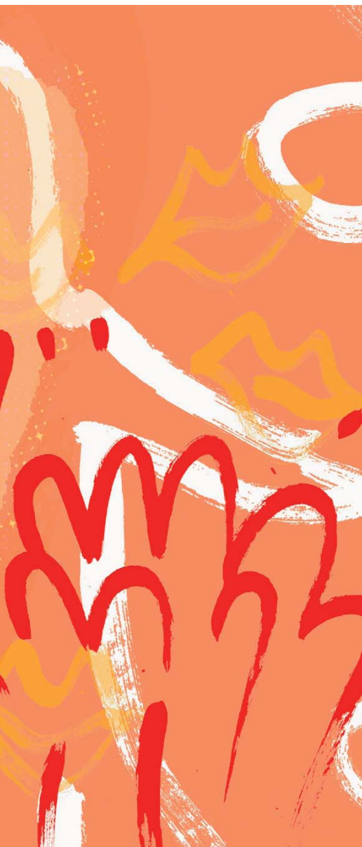
Illustratie: Albert Hemmipman